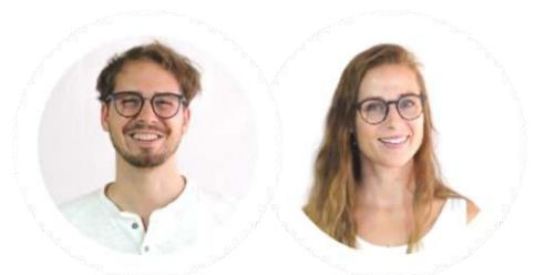
Layout und Illustrationen: Lukas Wicki Überarbeitung: Jasmin Huber

Dies ist ein Fantasiewort, deswegen ist Kreativität Ihrerseits gefragt. Ich freue mich über ein Bild von Ihnen! 😊 lukas.wicki@schulen-emma.ch